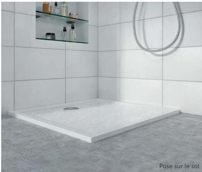
Pose sur le sol