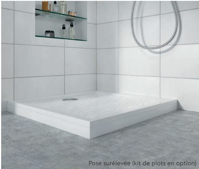
Pose surélevée (kit de plots en option)